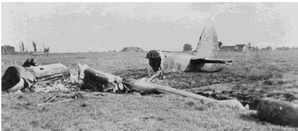
Het op 10 mei in de Tedingerbroekpolder neergeschoten vliegtuig van de Duitse luchtmacht