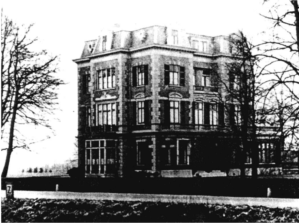
Huize Dorrepaal, waarin Duitsers van de vroege morgen tot ± 14.00 uur de Oude tolbrug en omgeving onder vuur hielden.